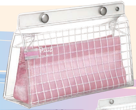
透明ケースには ペンは15本入る