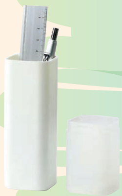
ユートリム Utlim スタンドペンケース ハードタイプ (ソニック、660円)

コンパクトな形とサイズで、バッグに入れてもかさばらない。必要最低限のペンだけ持ち歩きたい人におすすめ。同じシリーズで発売中の「ユートリム スマ・スタ ワイド A5 立つバッグインバッグ」に納まりがいいよ。