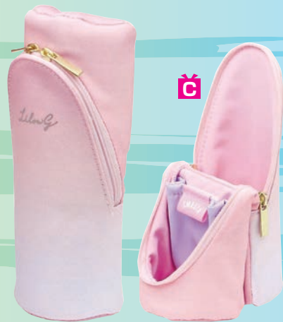
Utlim スマ・スタ リル グラデ 立つペンケース (ソニック、1760円)