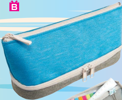
2レイヤーペンケース (レイメイ藤井、1430円)

上部と中部に2本のファスナー付き。用途に合わせて上下それぞれにものを収納して。上段の底はメッシュポケット付きだから、付せんやシールなど細かいものを入れられる。小物やコスメを入れたり、トラベルポーチとして使ったりしても便利そう。