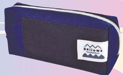
ベロウズ ペンケース (コンサイズ、1540円)

ジャバラ式のパーツを引き出して使う。中が見やすく、出し入れしやすい。シンプルな姿で使い勝手がいいよ。カジュアル感のあるダークカラーの配色で、飽きがこない。