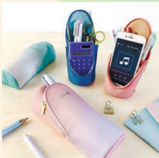
コスメにもおすすめ♡

パカッと開いてマグネットでピタッと固定、スタンドタイプに早変わり。手前のポケットにはスマホも入っちゃう。シンプルなグラデーションカラーが大人かわいい「スマ・スタ」。いろいろな使い方ができそう。