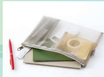
淡くてきれいな全4色